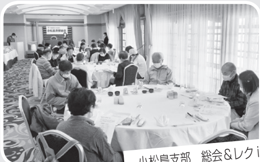
小松島支部 総会&レク in アオアヲナルリゾート