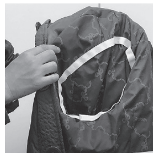
袖口に印をつけて通す場所をわかりやすく

付きのステッチをつけたり、靴紐を結ぶのが難しかったら、最近ではダイヤル式で結ぶ靴もあります。