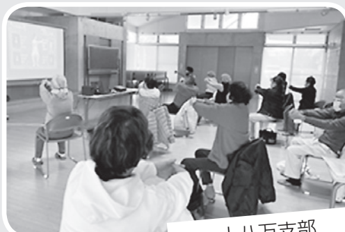
上八万支部 いきいき百歳体操