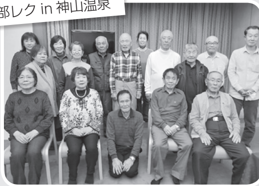
石井支部 支部レク in 神山温泉