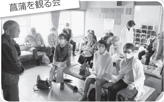
渭北支部 菖蒲を観る会