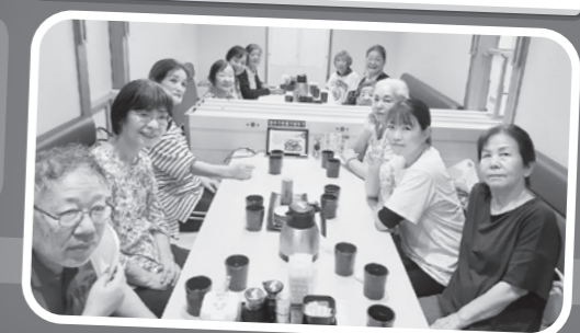
中央支部 お食事会