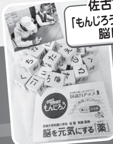
佐古支部 「もんじろう」を使って 脳トレ