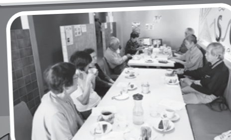
国府支部 班長交流会