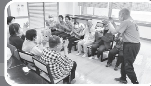
板野・北島支部 合同支部レク