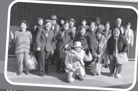
田宮・春日支部 支部レク in 鳴門グランドホテル海月