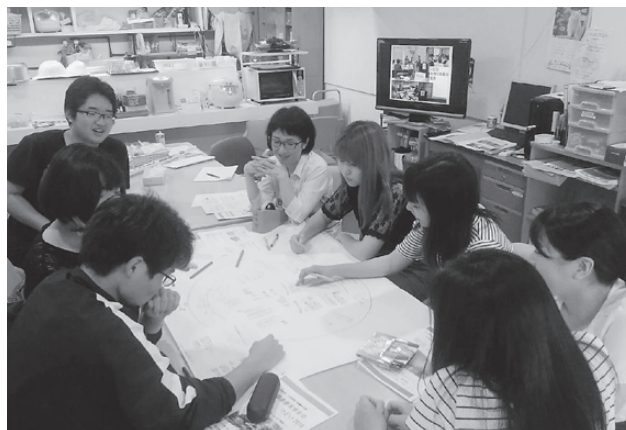
奨学生 学習交流会