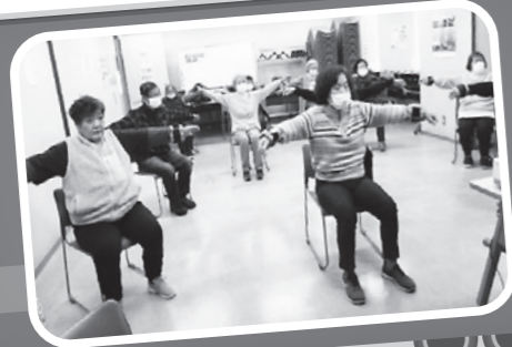
渭東支部 住民主体型100歳体操