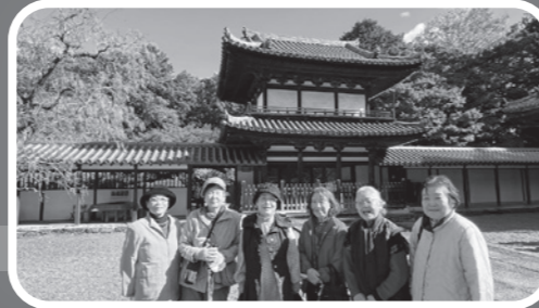
那賀川支部 紅葉狩り