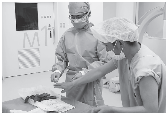
病院実習の様子(手術室体験)

奨学生会議に参加することで先輩に試験について聞けたり、上級生の大学生活の様子を知ることができます。