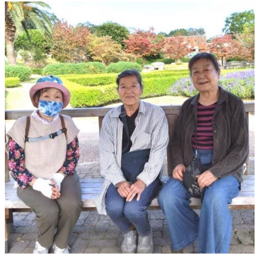
つくし班 10月12日(木)12時半から

皆でお店に集合して昼食を食べてから、日本一低い山弁天山に登り4人で参拝して神山森林公園に足を延ばし散策。まだ紅葉は早いのですが、ちょうど良い場所に紅葉樹が少しありました。飲み物・蒸しさつま芋等持参して、山里と町の暮らしの戦後の生き方現在の食べ物の不安、等々話が弾む!! 天気にも恵まれ楽しかったです。