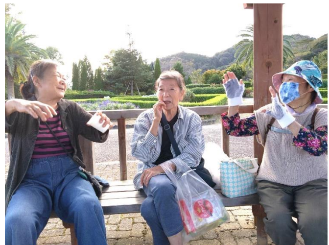
やさいの会 10月14日(土)3人10時~雨降る前に。ミウガが10月なのに、出てきます。+

皆でお店に集合して昼食を食べてから、日本一低い山弁天山に登り4人で参拝して神山森林公園に足を延ばし散策。まだ紅葉は早いのですが、ちょうど良い場所に紅葉樹が少しありました。飲み物・蒸しさつま芋等持参して、山里と町の暮らしの戦後の生き方現在の食べ物の不安、等々話が弾む!! 天気にも恵まれ楽しかったです。