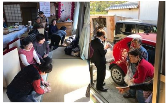
女性は内から外に禍(わざわい)をもたらす鬼は外!

「西南西」で丸かじり 恵方巻きは、目を閉じて願い事を思い浮かべながら、恵方に向かって無言で一本丸ごとの海苔巻きを丸かぶりすることから、「丸かぶり寿司」や「丸かじり寿司」とも呼ぶ、この風習は一時廃れたが、1970年代後半に大阪海苔問屋協同組合が道頓堀で行ったイベントによって復活、関西地方では一般的な風習となったよ。声を出してた方もいたよ!