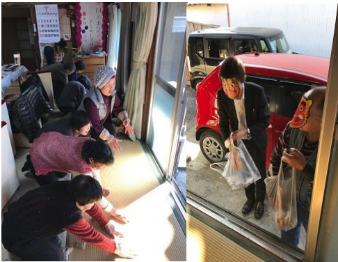
男性が幸運を招く福の神を外から中に福は内!

今年は一日遅れてでしたが、なると合同班会は、2月4日に節分を祝いました。節分は「みんなが健康で幸せに過ごせますように」という意味をこめて、悪いものを追い出す日。「鬼は外、福はうち」と言いながら豆まきをします。節分という言葉には、「季節を分ける」という意味があるそうです。昔の日本では、春は一年のはじまり、特に大切にされました。そのため、春が始まる前の日、冬と春を分ける日だけを節分と呼ぶようになりました。